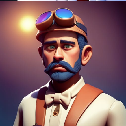
Don Carlos de Manchego